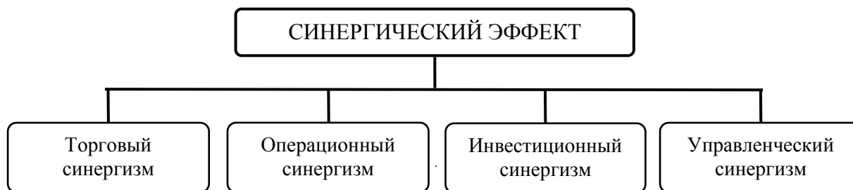
Рисунок 2 – Классификация синергического эффекта

► Требования к оформлению приложений. Приложения оформляются как продолжение отчета о НИР на последующих её листах. Приложения должны иметь общую с остальной частью отчета о НИР сквозную нумерацию страниц.